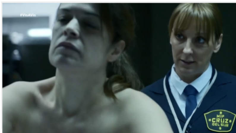
Figura 7. Escena Vis a vis 1x01.

Asimismo, en la siguiente secuencia representada a través de la figura 8, se observa como la gobernanta para poner orden en el comedor muestra una actitud ruda. Esto se ve reflejado en las siguientes expresiones de los funcionarios que visionan las cámaras de seguridad observando como ella cachea a las reclusas: “Paloma que cojonazos tienes”, “Con lo chiquitita que es mírala”