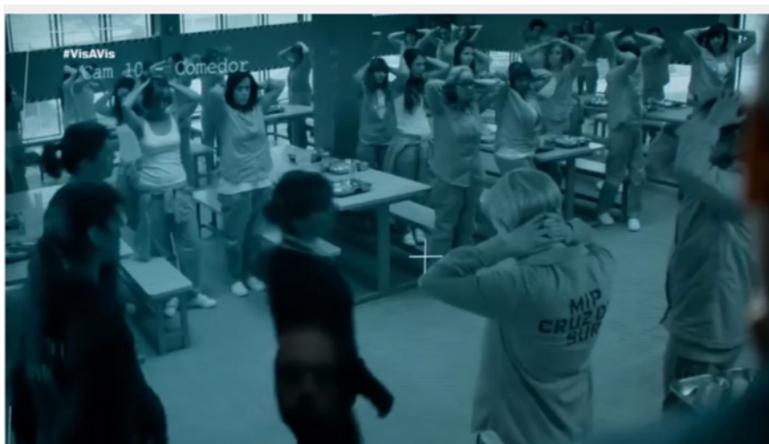
Figura 8. Escena Vis a vis 1x01.

Asimismo, en la siguiente secuencia representada a través de la figura 8, se observa como la gobernanta para poner orden en el comedor muestra una actitud ruda. Esto se ve reflejado en las siguientes expresiones de los funcionarios que visionan las cámaras de seguridad observando como ella cachea a las reclusas: “Paloma que cojonazos tienes”, “Con lo chiquitita que es mírala”