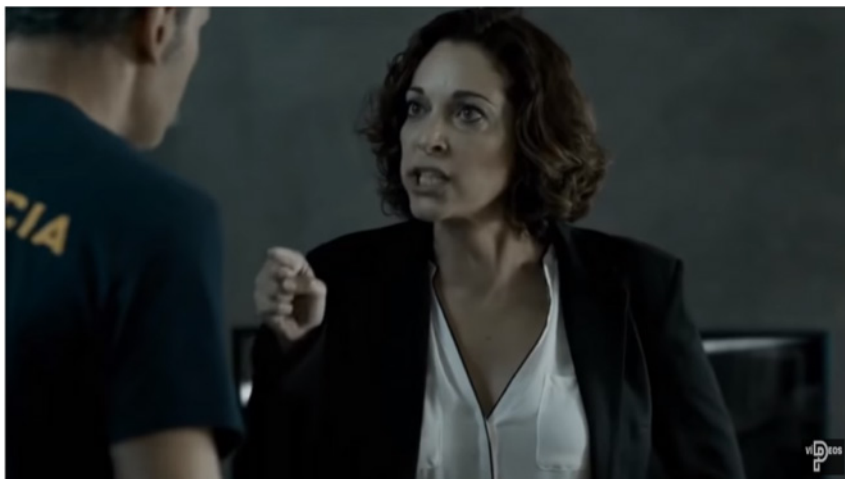
Figura 10. Escena Vis a vis 1x09.