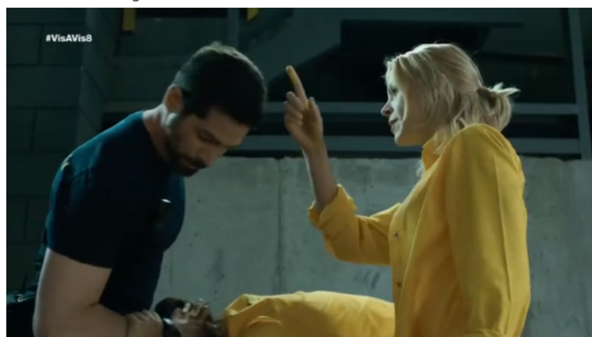
Figura 5. Escena Vis a vis 1x08.

En la escena representada a través de la figura 5 se muestra a Macarena en una actitud de control de la situación. En este proceso en el que se visibiliza un cambio de en su actitud, ha ganado en confianza y valentía. No obstante, en esta escena aún se hace una destacada referencia a su inteligencia por encima de