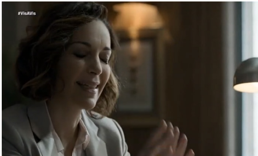
Figura 9. Escena Vis a vis 1x01.