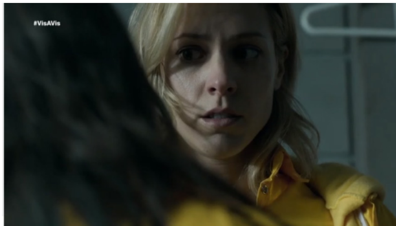
Figura 3. Escena Vis a vis 1x01.

Del mismo modo, puede observarse ese mismo cambio en su expresión corporal pasando de la figura 3 en la que muestra un estado de inseguridad y miedo, a las figuras 4 y 5 en las que aparece defendiendo a una reclusa ante un funcionario y transmitiendo autoridad y seguridad en sí misma.