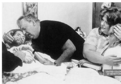
Figura nº 10: Benetton

publicitarias más polémicas de los últimos años fue la de la marca Benetton. Algunas de sus piezas son legítimos ready-mades . En una de ellas (fig. 10), su idealizador, Oliviero Toscani (1996:59-60), se apropió de una foto, hecha por Thereza Frare, de un enfermo terminal de SIDA, junto a su familia, y sólo sobrepuso en un rincón el logotipo Benetton.