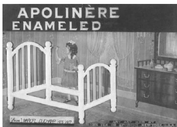
Figura nº 9: Apolinère Enlameled

El segundo ready-made que nos interesa es “Apolinère Enlameled” (fig.9). Como un homenaje al poeta Guillaume Apollinaire, que era un incentivador de las vanguardias – inventor incluso de los caligramas –, el artista utilizó íntegramente un anuncio de las tintas Sapolin, poniendo en su extremidad superior una tapa oscura en la cual escribió “Apolinère Enlameled”, y en la extremidad inferior una especie de firma y la fecha – “From Marcel Duchamp, 1916/1917”.