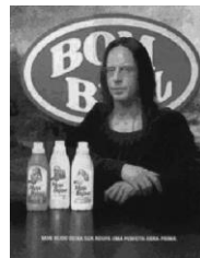
Figura n° 12: Mon Bijou