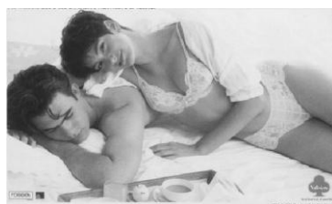
Figura nº 1: Valisére