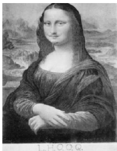
Figura n° 11: L.H.O.O.Q