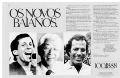
Figura nº 7: Pelourinho

las imágenes, en vez de los músicos, tenemos la foto de tres personalidades mundiales (Paul Simon, Akio Morita y Julio Iglesias), que habían hecho donaciones a esa causa, conforme el texto esclarece.