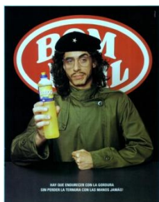
Figura nº 3: Limpol

terizado de Che Guevara (asociación por semejanza) y el título “Hay que endurecerse con la grasa sin perder la ternura con las manos jamás”, que modifica la célebre sentencia del guerrillero “Hay que endurecerse sin perder la ternura jamás”.