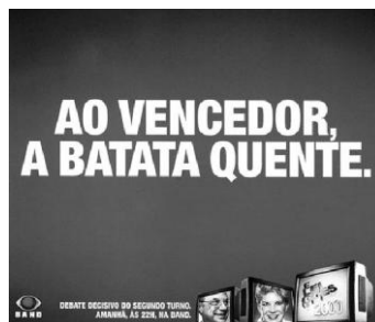
Figura nº 4: TV Bandeirantes

Fuente: 26° Anuario del Clube de Criação de São Paulo