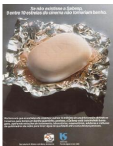
Figura nº 6: Sabesp

Otro ejemplo de paráfrasis “doble”, en el que el texto verbal y el visual utilizan una citación, podemos encontrarlo en ese anuncio de Sabesp (fig.6). En el ámbito de las imágenes, hay una foto de un jabón Lux (el producto es “citado”) y, en el plano lingüístico, tenemos el título “Si no existiese Sabesp, 9 entre 10 estrellas del cine no se ducharían”, que dialoga con un famoso eslogan de esa marca de jabón “9 entre 10 estrellas del cine usan Lux”.