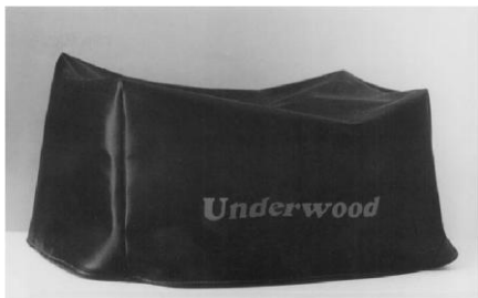
Figura nº 8: Pliant...de voyage