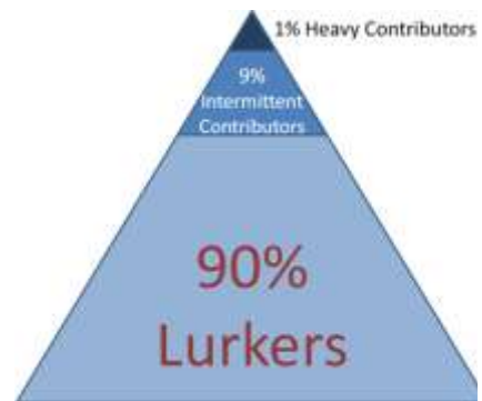
Grafico2: Ley de la inequidad

los usuarios es muy desigual y utilizando este criterio ha definido la denominada Ley de la inequidad o del 90-9-1. El 90% de los usuarios leen los contenidos pero no contribuyen con sus comentarios, un 9% participa de forma intermitente -pues otras prioridades ocupan su tiempo disponible- y, por último, un 1% participa de manera constante, con una participación casi instantánea ante cualquier nueva opinión o información 4 . Resulta llamativo que Mark Penn, destacado profesional de las relaciones públicas, proponga una proporción similar a la de Nielsen para diagnosticar aquellas microtendencias que nos pueden servir para indicar la evolución en los gustos de los consumidores 5 .