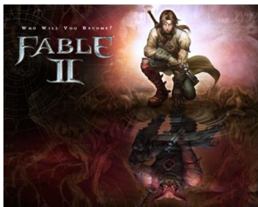
Gráfico 2: Fable II