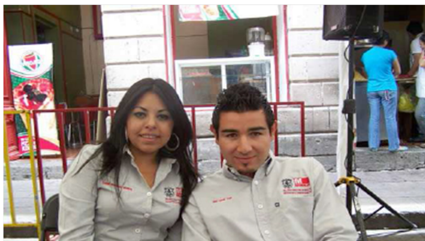
Figura 3: Imagen de amistad con el otro sexo (Seleccionada en focus de chicos y de chicas).