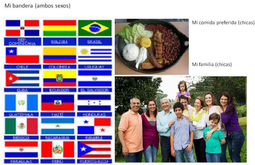
Figura 2: Imágenes seleccionadas por los jóvenes latinoamericanos relativas al arraigo cultural.

este arraigo se evidencia en aquellas relacionadas con los símbolos patrios (banderas nacionales), con la gastronomía y con la representación de la familia extensa; y su relevancia aparece más marcada entre las chicas que entre los chicos.