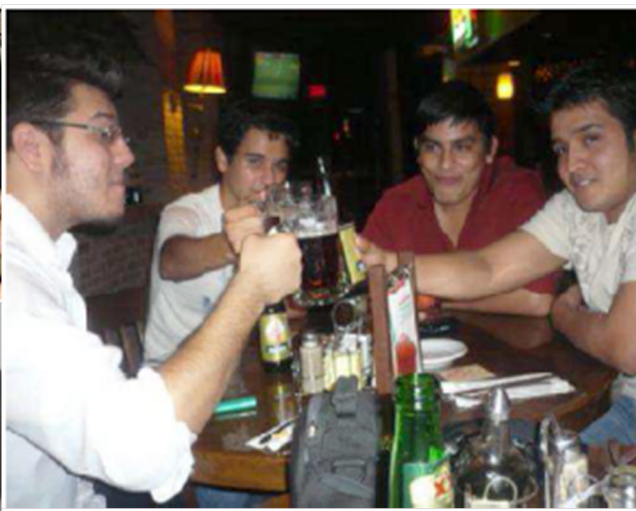
Figura 1: Fotos seleccionadas en los focus por los jóvenes latinoamericanos.

Aunque pudiera pensarse que las relaciones de amistad y compañerismo de la juventud latinoamericana en España estarían marcadas por las redes de procedencia; es decir, los jóvenes tenderían a relacionarse más con chicos y chicas de su propia nacionalidad. La realidad, a partir de sus opiniones, apunta más hacia un panlatinoamericanismo , donde las relaciones aparecen marcadas por la cercanía cultural y de lenguaje con otros jóvenes de países latinoamericanos.